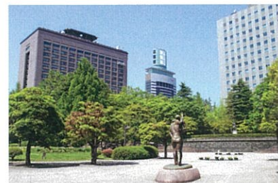
勾当台公園から眺める宮城県庁と仙台合同庁舎