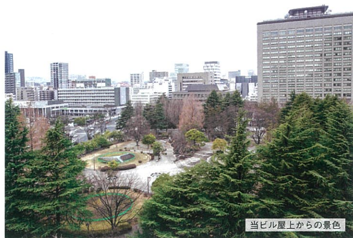
当ビル屋上からの景色