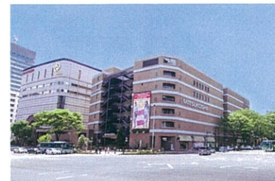
東北地方で最大級の売り場面積を誇る仙台三越